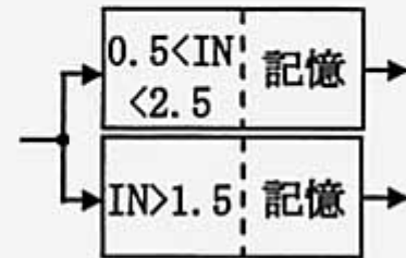
図1: 4値フリップフロップ(FF)の構成