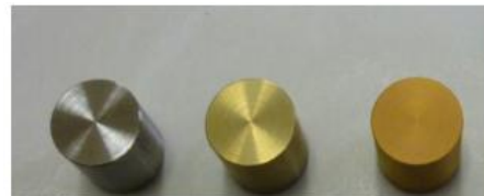
膜厚や色調を制御したTiNコーティング