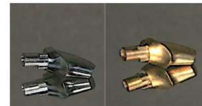
複雑形状の基材にも均質にコーティング可能